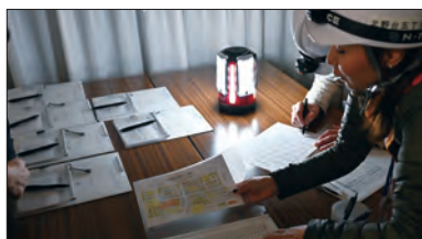
停電を想定し、非常灯のあかりで行動の確認をする

ヘルメットにヘッドライトを装着し、まずメガホンで『巨大地震発生のため黄色いタオル掛けの呼びかけ』を行い、その後、一軒一軒黄色いタオルを確認、タオルが掛かってない家はインターホンで安否確認を行い、494世帯のうち、黄色いタオル掛けは383軒(76%)確認、インターホンでの確認(64軒)を合わせると、447軒(90%)の安否確認を行うことができました。お忙しい時間帯の中、皆様のご協力ありがとうございました。 今回は夜の暗い中での訓練でいつもより大変な中、ボランティアの皆様、役員の皆様、震災時安否確認・支援チームのご協力を心より感謝申し上げます。