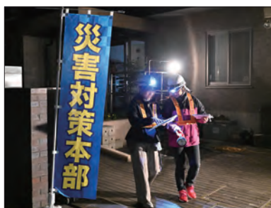
ヘルメットにヘッドライトを装着して出発