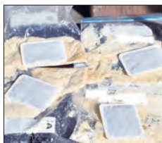
粉っぽさがなくなるまでよく揉んだ生地を、日なたに並べて発酵を促す

天候にも恵まれ、とても楽しいひとときでした。孫もとても喜んでいました。自分でパンを作ったと誇らしげに家族に伝えていました。アンケートを拝見して、少しでも地域の方の架け橋になれたのかな～とも思いました。