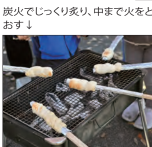
炭火でじっくり炙り、中まで火をとおす↓