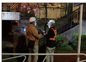
← 安否確認チームは、2人1組で担当コースを回ります

タオルを確認したら、リストをチェックし、確認済みのメモを郵便受けに投函します →